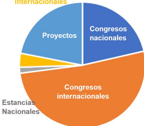
Movilidad Estudiantes de Maestría

La Maestría en Ciencias en la Especialidad de Matemática Educativa es un programa con reconocimiento de nivel Internacional en el Padrón del Programa Nacional de Posgrados de Calidad del Conacyt, por lo que sus estudiantes pueden postular para la obtención de alguna beca en las Convocatorias de Becas Nacionales de dicho organismo, siempre y cuando cumplan con los requisitos que el Conacyt establece para tales efectos.